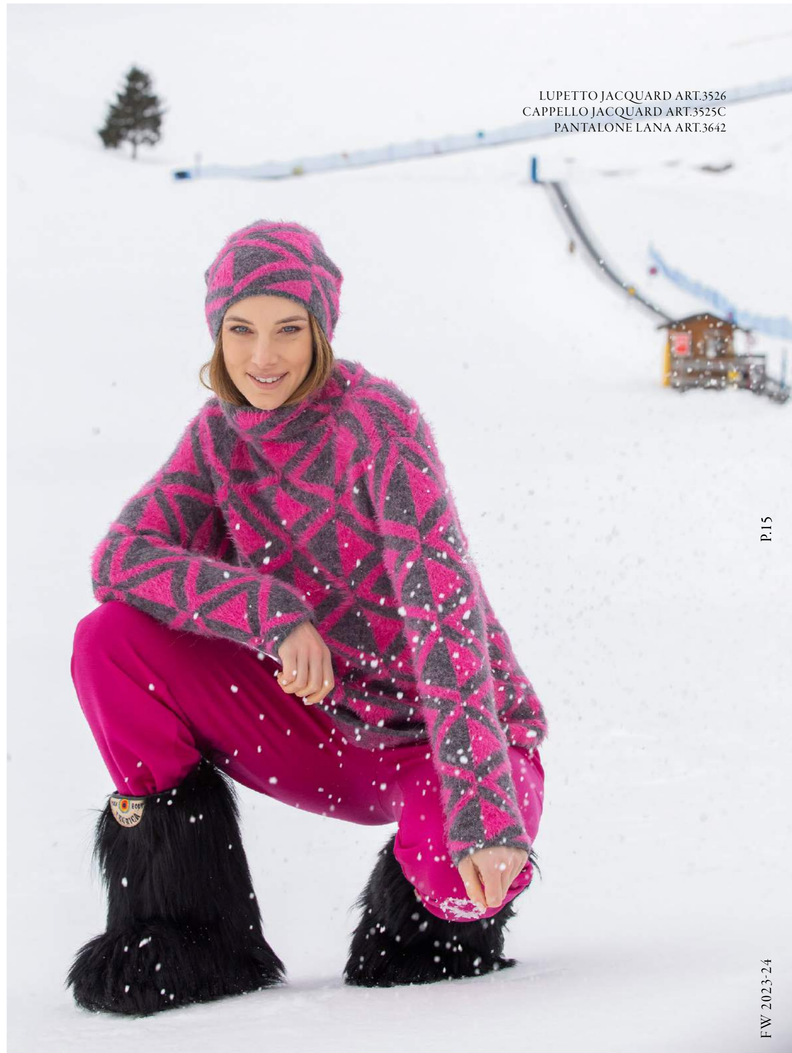
LUPETTO JACQUARD ART.3526 CAPPELLO JACQUARD ART.3525C PANTALONE LANA ART.3642