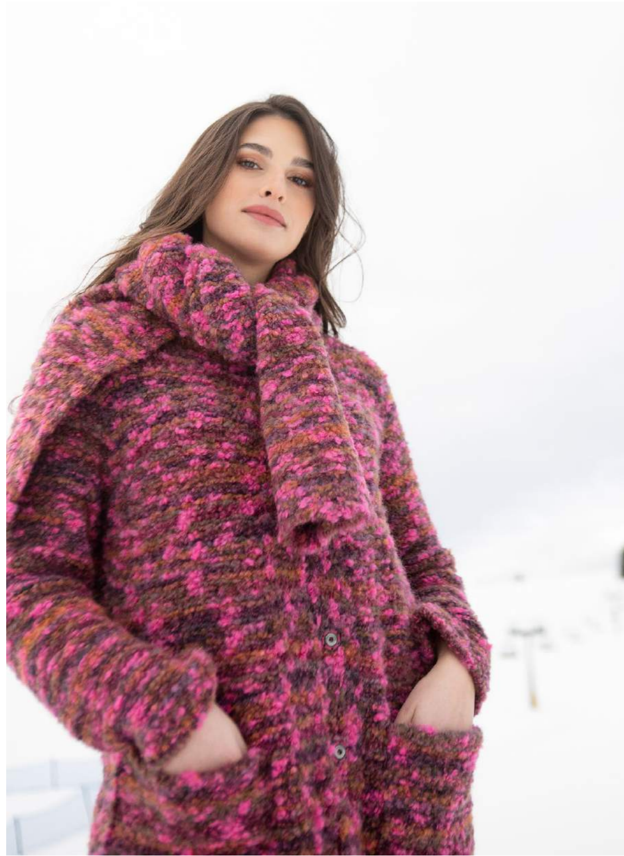
CAPPOTTO ART.3500 PONCHO ART.350 DOLCEVITA ART.3655 PANTALONE LANA ART.3653