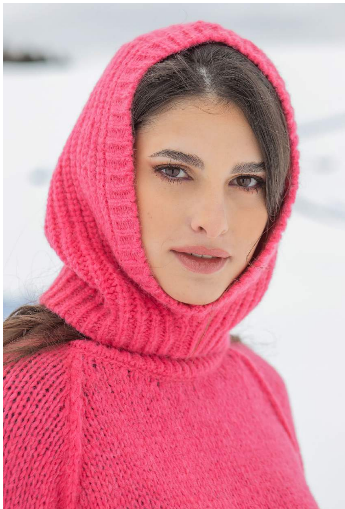
LUPETTO ALPACA ART.3508. CAPPUCCIO ALPACA ART.3520CP