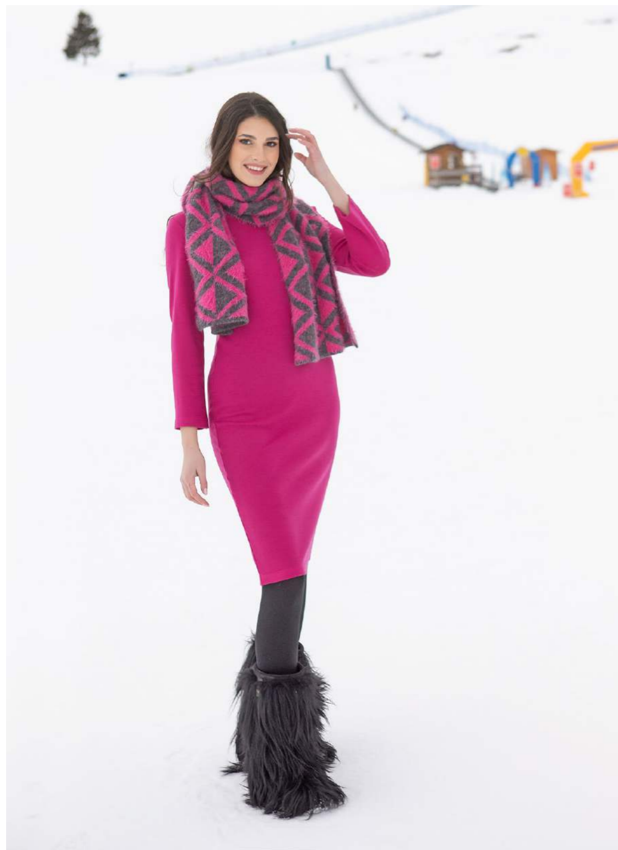
ABITO LANA ART.3644. SCIARPA JACQUARD ART.3525