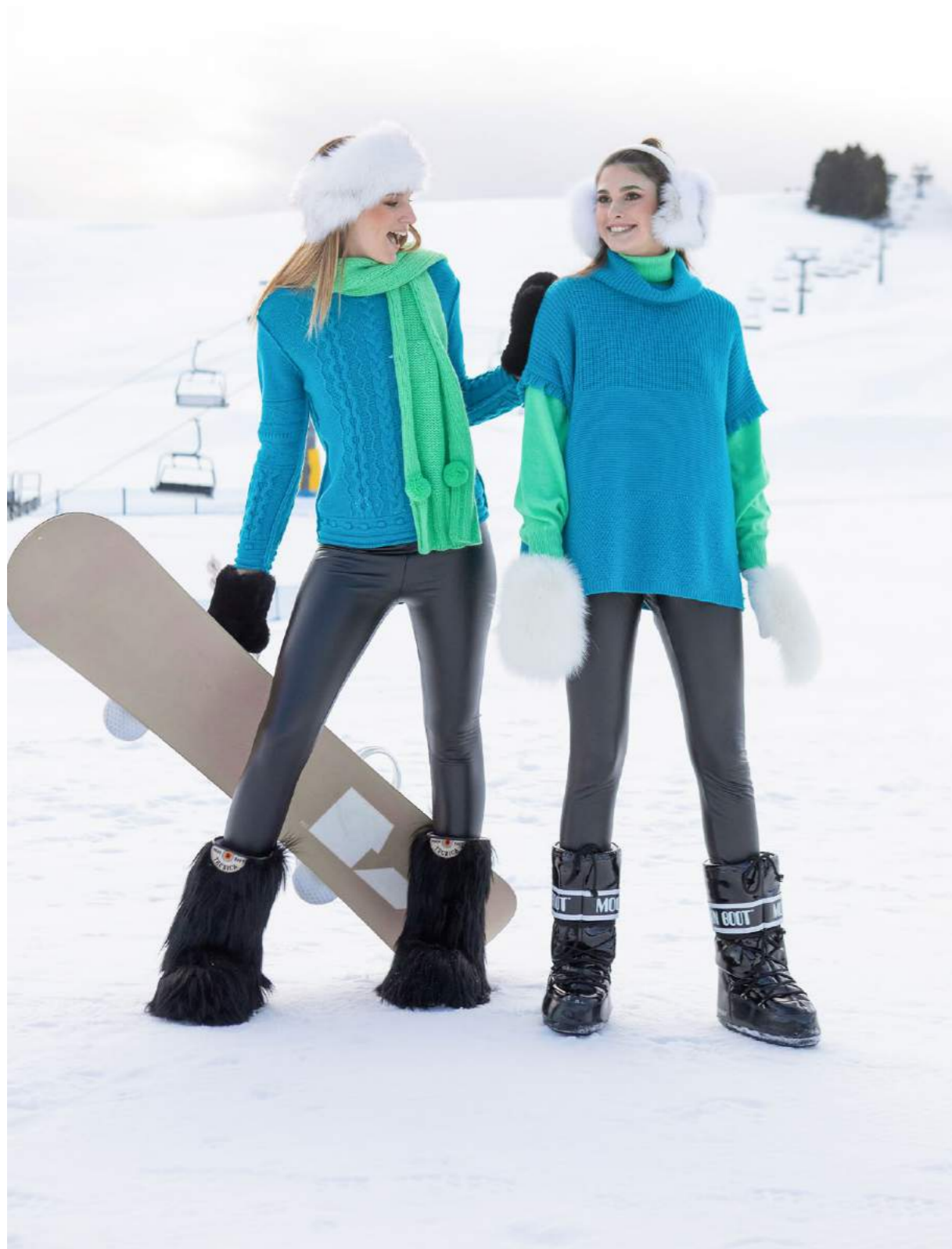
GIROCOLLO LOSANGHE LANA ART.3614 SCIARPA ALPACA ART.3519 PONCHO LANA FRANGE ART.3604. DOLCEVITA CACHEMIRE ART.3591