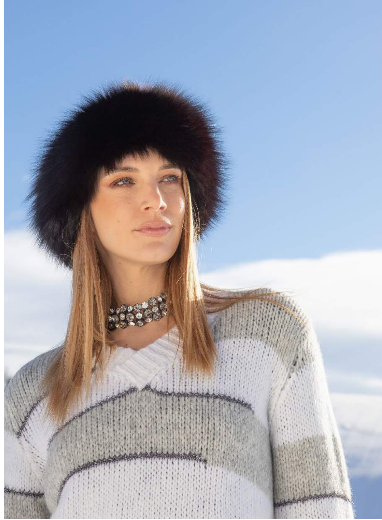
: PULLOVER RIGHE ALPACA ART.3516 GONNA RASO ART.3666