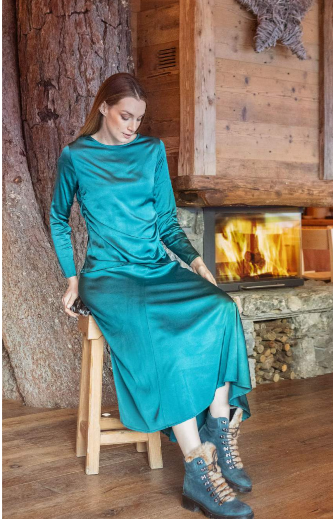
GIROCOLLO ARRICCIATURE RASO ART.3660 GONNA RASO ART.3666 GIACCHINA PELLICCIA ART.3600