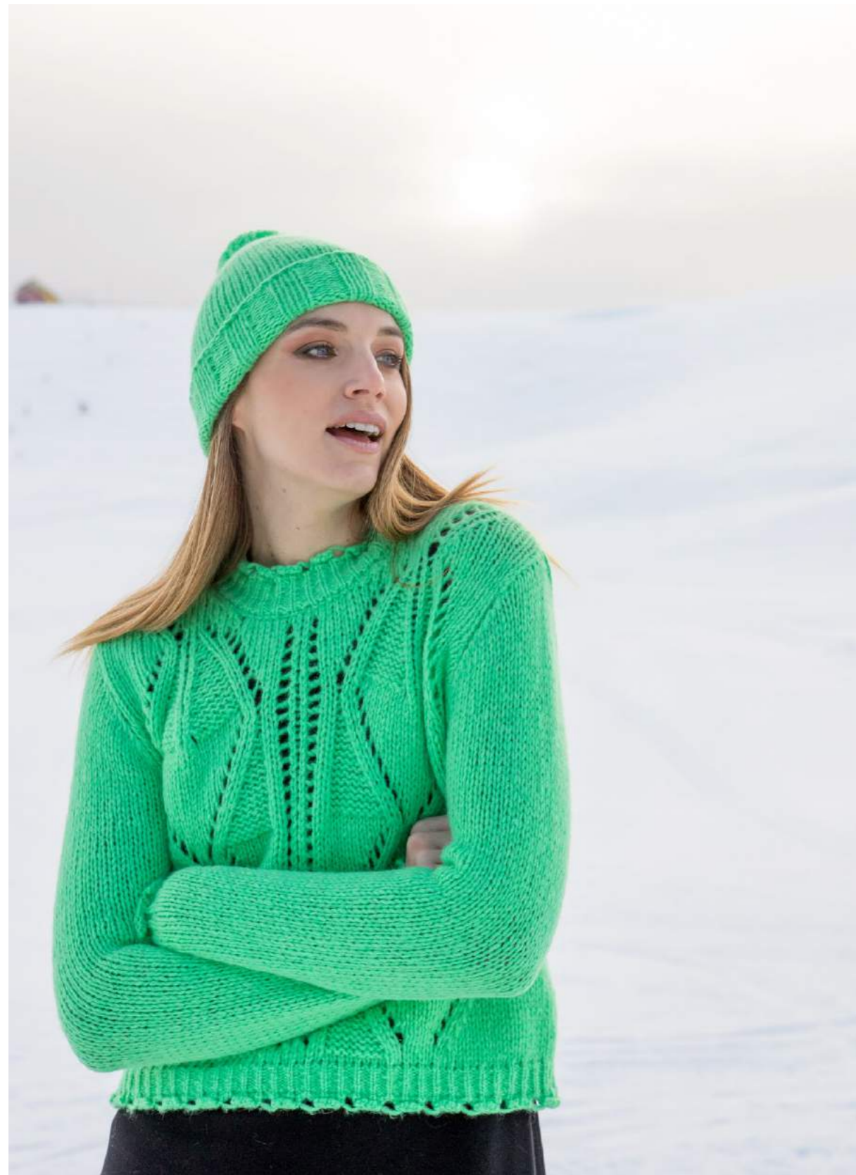
GIROCOLLO PUNZONATO ALPACA ART.3514 CAPPELLO ALPACA ART.3520