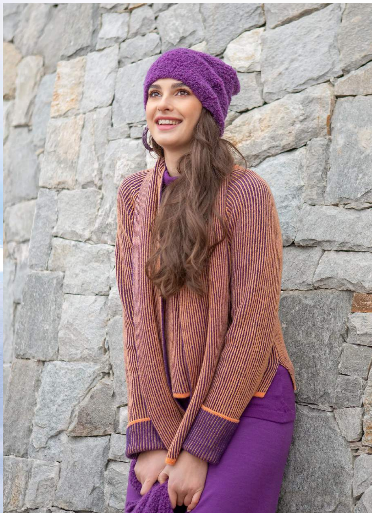
GIROCOLLO INGLESE CACHEMIRE ART.3576. SCIARPA ART.3575 DOLCEVITA LANA ART.3655. PANTALONE LANA ART.3642 CAPPELLO BOUCLÉ ART.3551