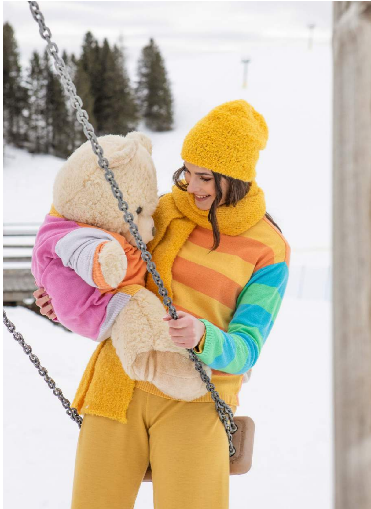
GIROCOLLO CACHEMIRE MULTIRIGHE ART.3585 SCIARPA BOUCLÉ ART.3553. CAPPELLO BOUCLÉ ART.3551 PANTALONE LANA ART.3653