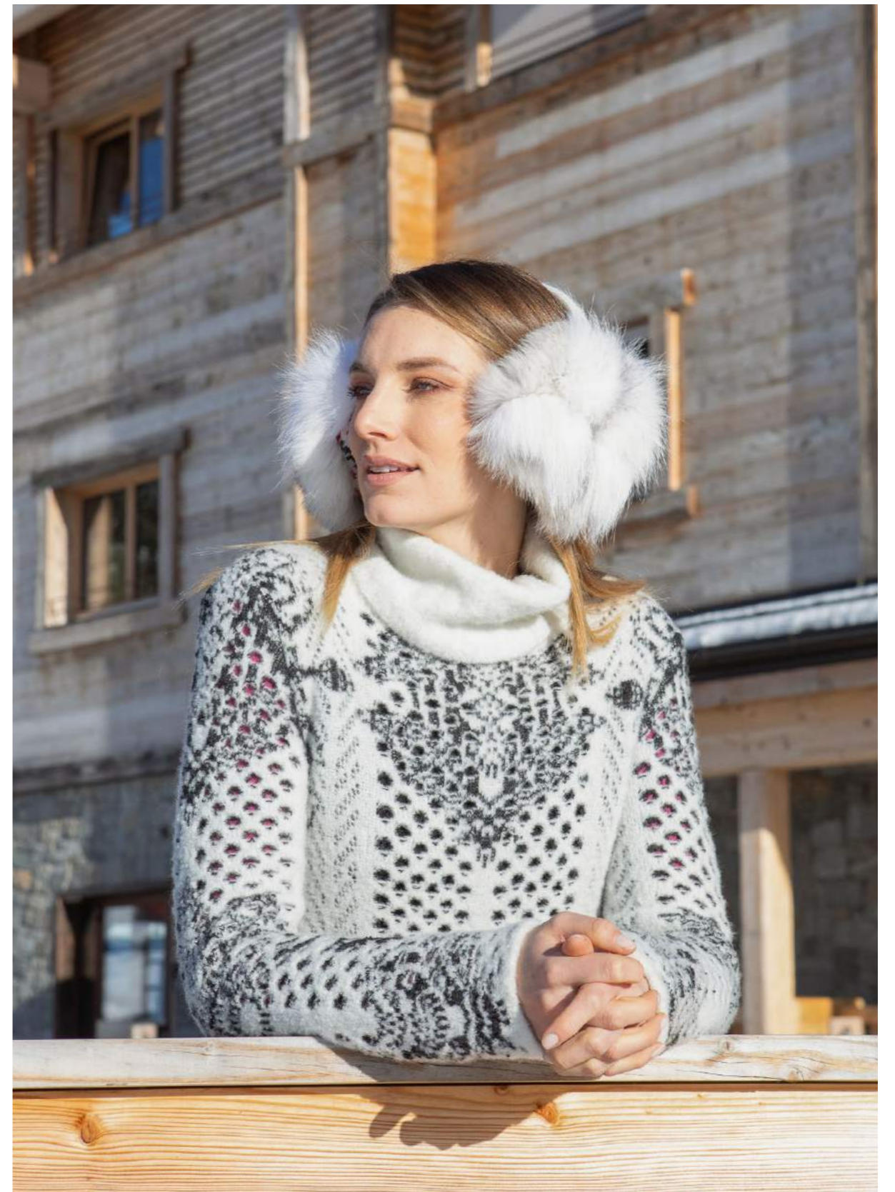
CIAMBELLA JACQUARD PUNZONATO ART.3522