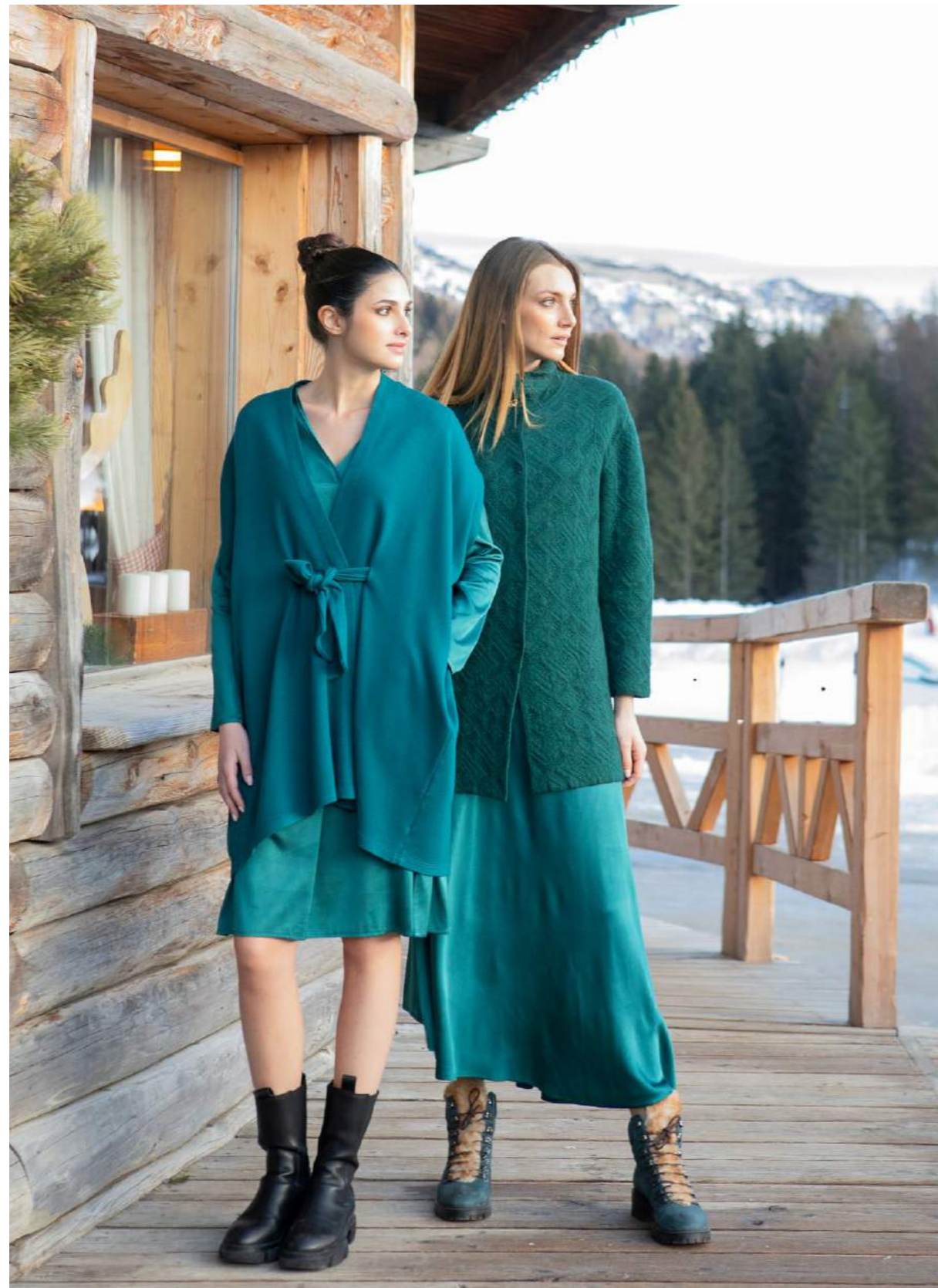
PONCHO LANA ART.3638. ABITO RASO ART.3664 GIACCONE JACQUARD RILIEVO ART.3556. GONNA RASO ART.3666