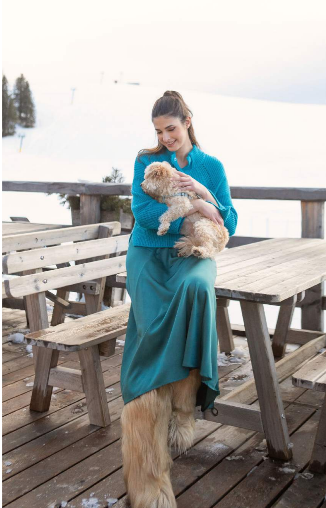
LUPETTO INGLESE LANA ART.3610 GONNA RASO ART.3666