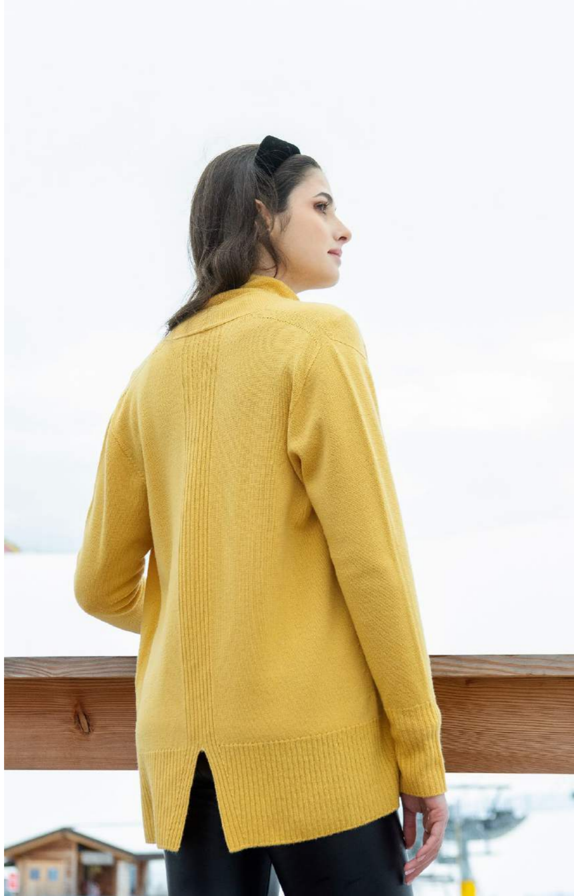
GIACCA LANA ART.3620. DOLCEVITA LANA ART.3655