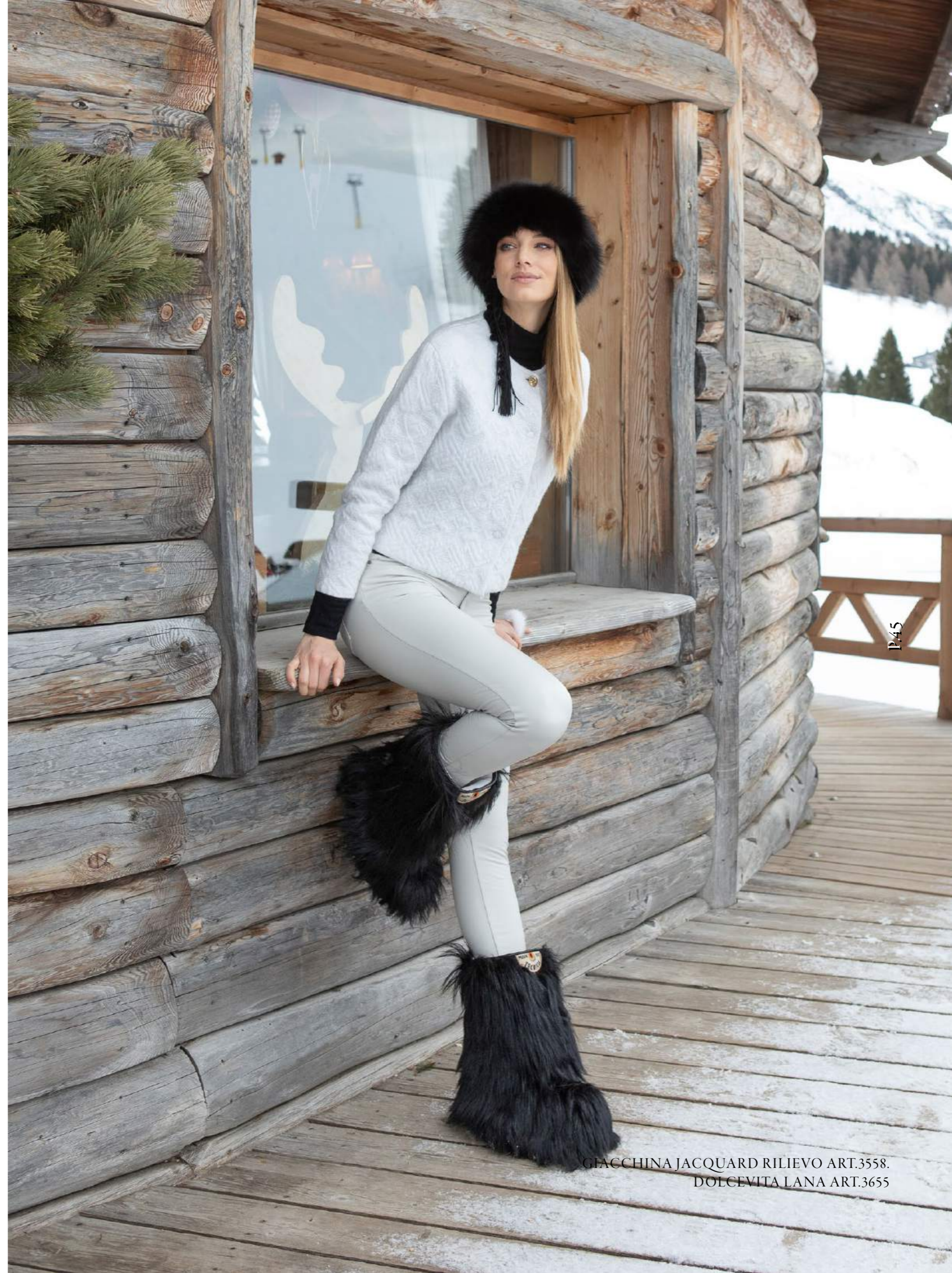
GIACCHINA JACQUARD RILIEVO ART.3558. DOLCEVITA LANA ART.3655