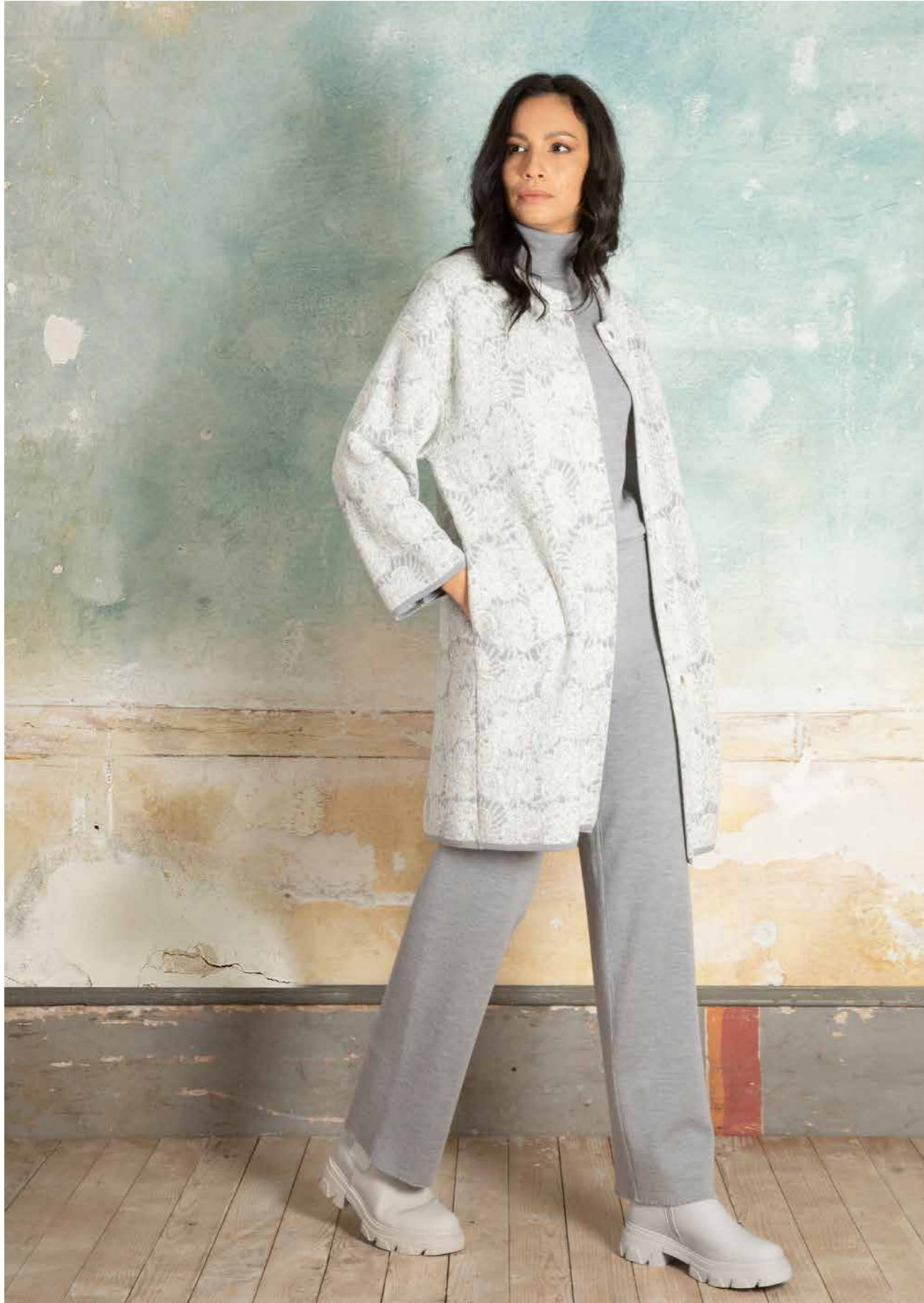
CAPPOTTO ART.2660, DOLCEVITA ART.2685, PANTALONE ART.2686