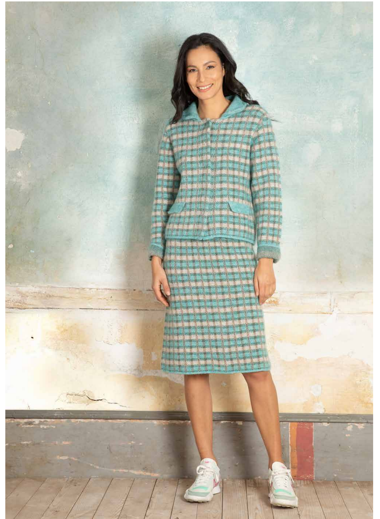
GIACCA POLO ART.2520, GONNA ART.2522