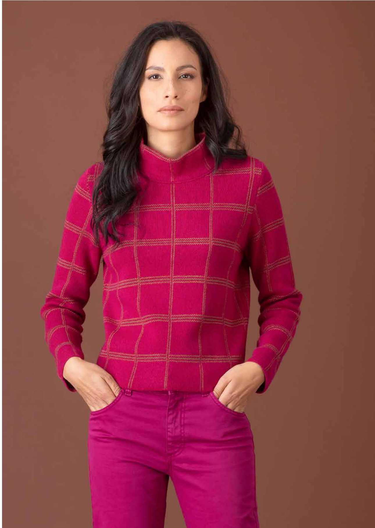
LUPETTO QUADRI ART.2552, PANTALONE ART.2700