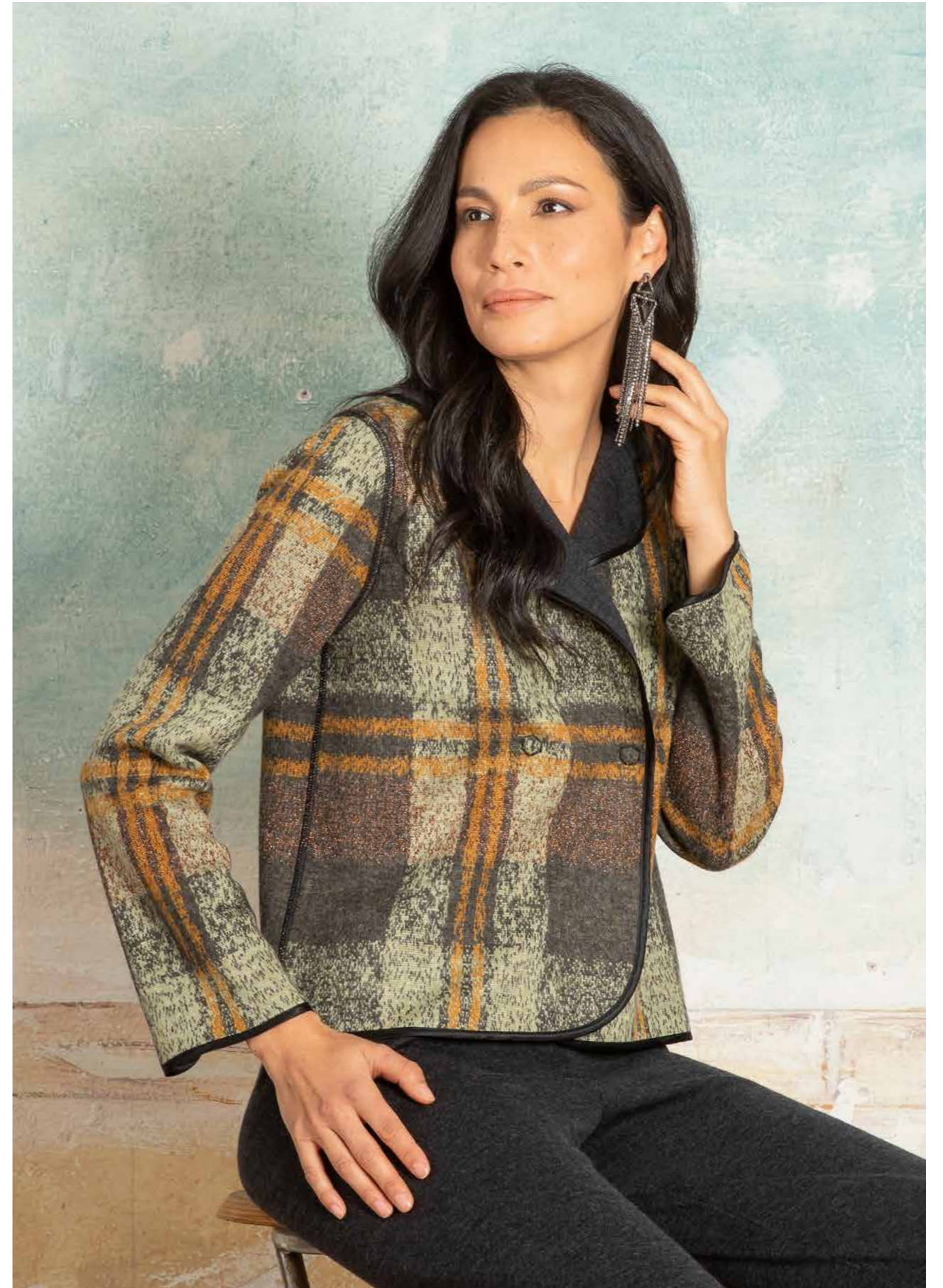
GIACCA DOPPIO PETTO REVERSIBILE ART.2600, PANTALONE ART.2686