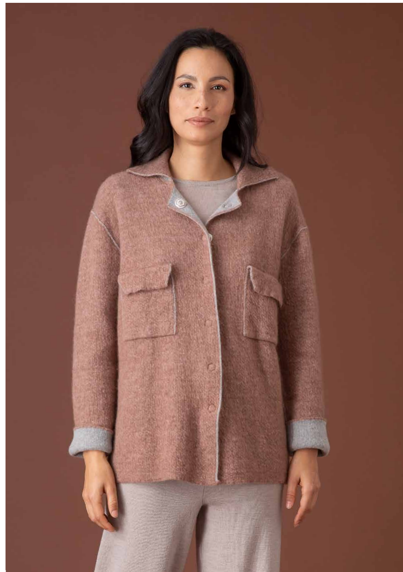
GIACCA DOUBLE ART.2588, GIROCOLLO ART.2684, PANTALONE ART.2686