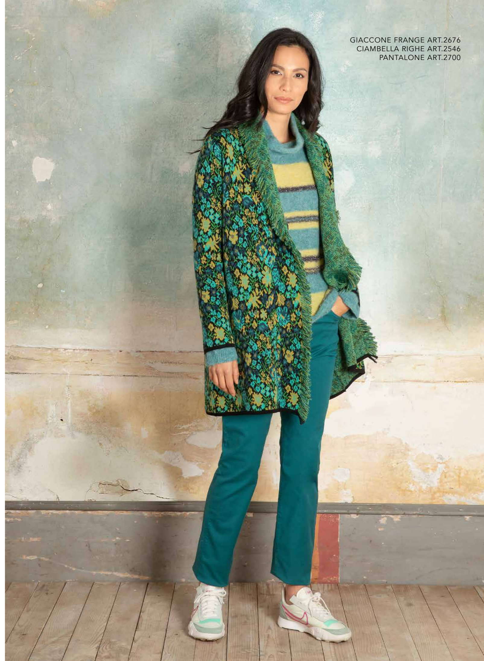
GIACCONE FRANGE ART.2676 CIAMBELLA RIGHE ART.2546 PANTALONE ART.2700