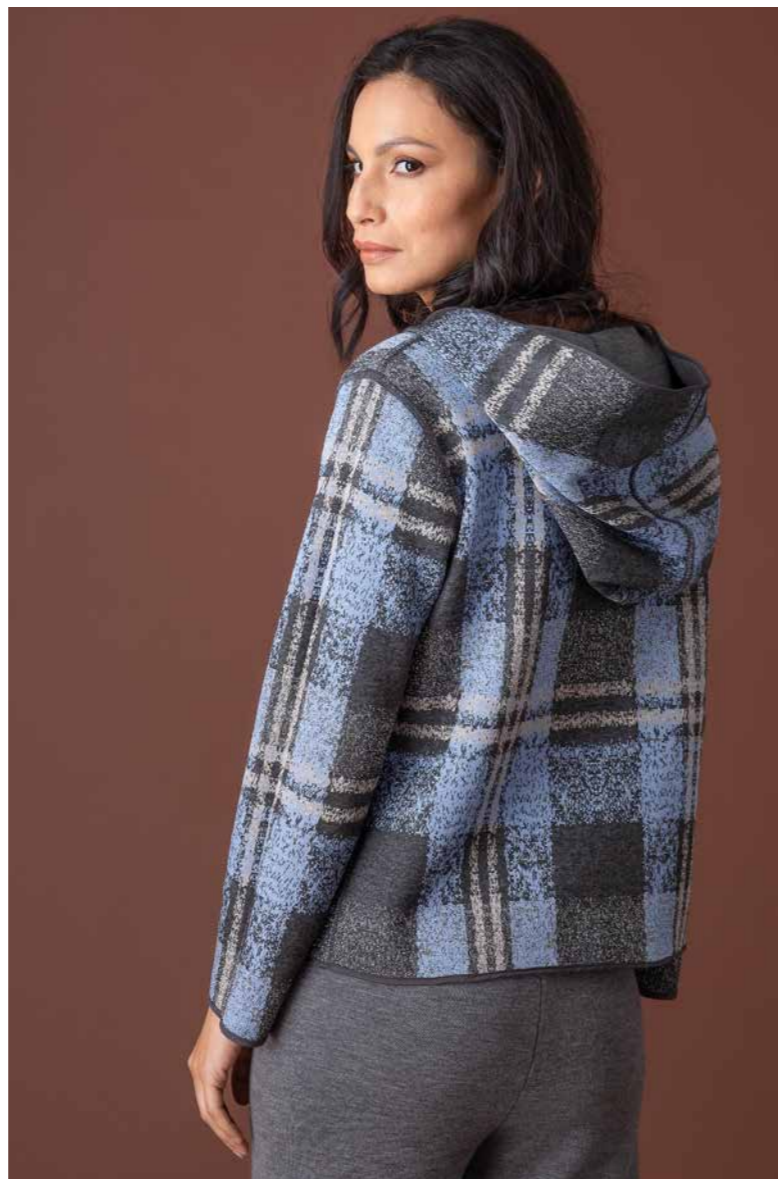
GIACCA CAPPuccio REVERSIBILE ART.2598, PANTALONE ART.2686