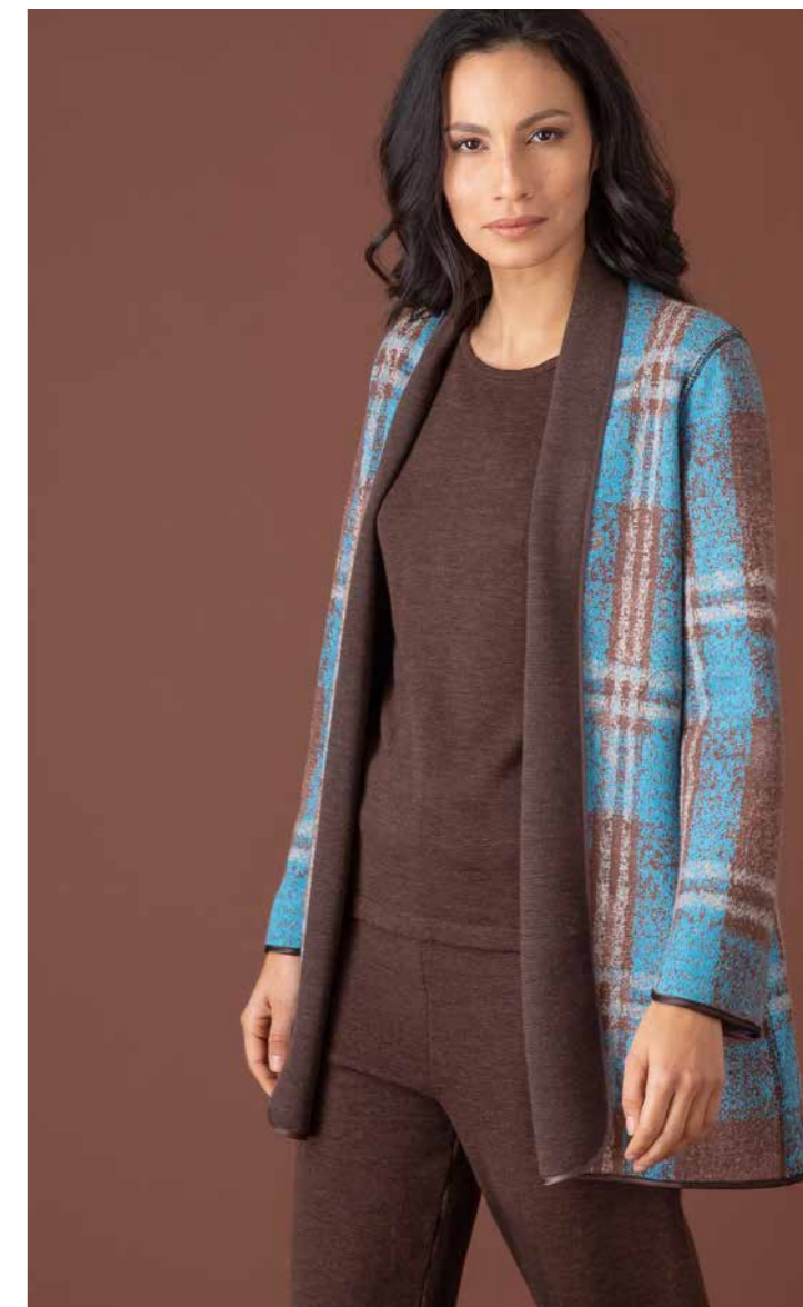
GIACCA REVERSIBILE ART.2596, GIROCOLLO ART.2684, PANTALONE ART.2686