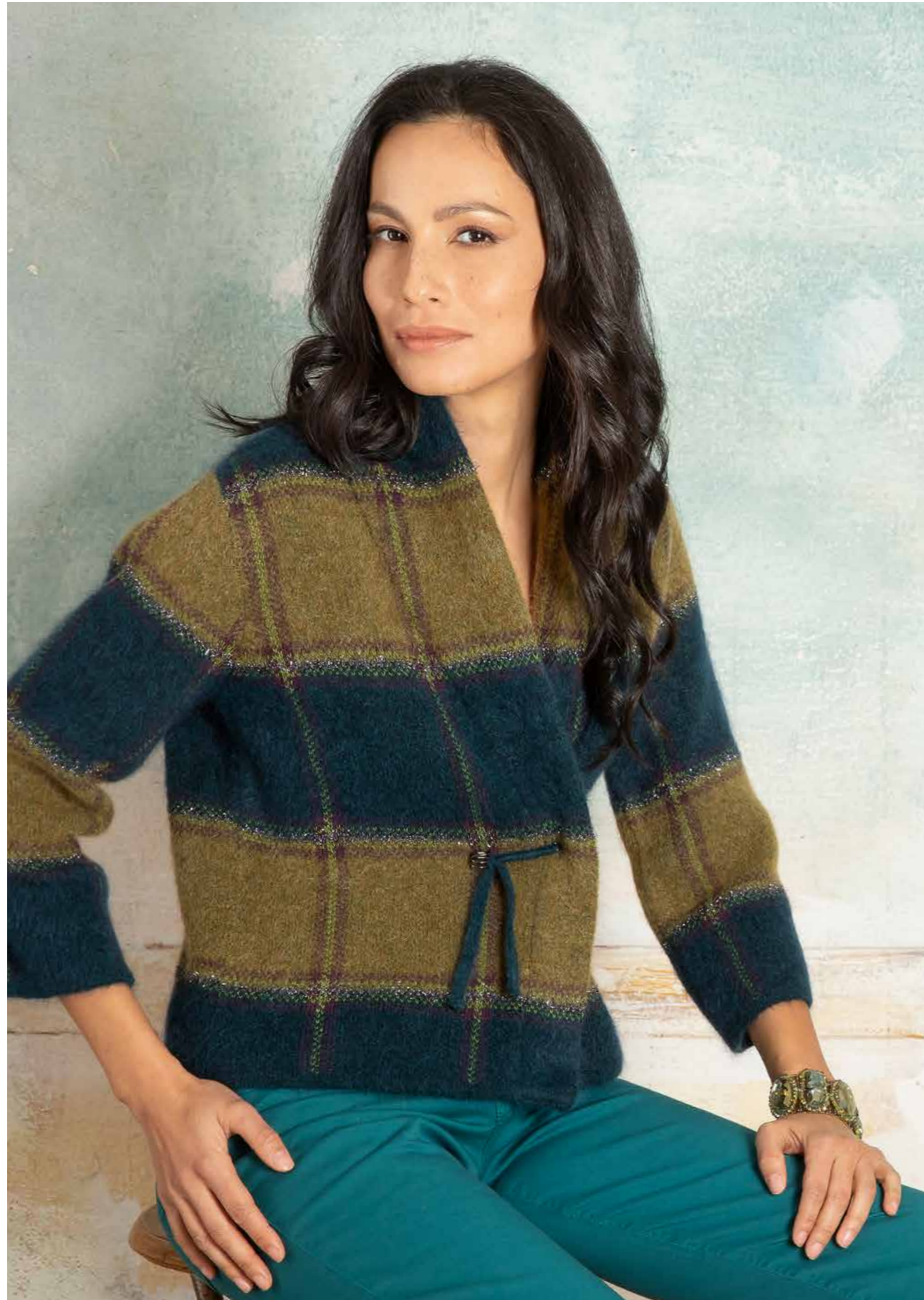
GIACCA CORTA ART.2514, PANTALONE ART.2700